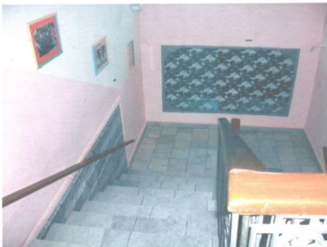
Фотография № 7