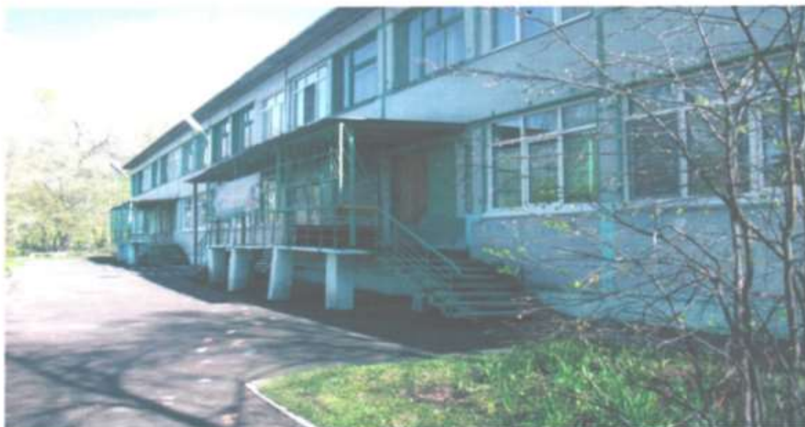
Фотография № 2