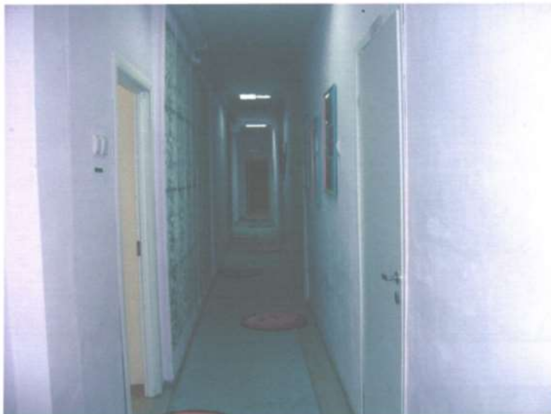
Фотография № 3